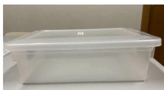
MODELO DA CAIXA PLÁSTICA (30 cm x 25 cm)